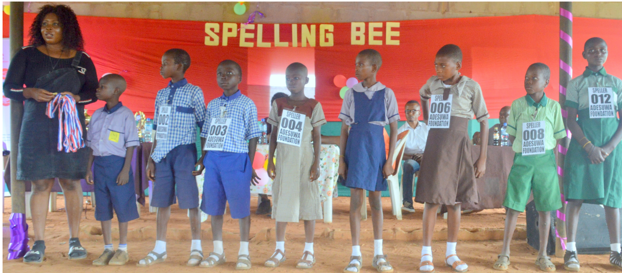
Gewinner des Buchstabierwettbewerbs