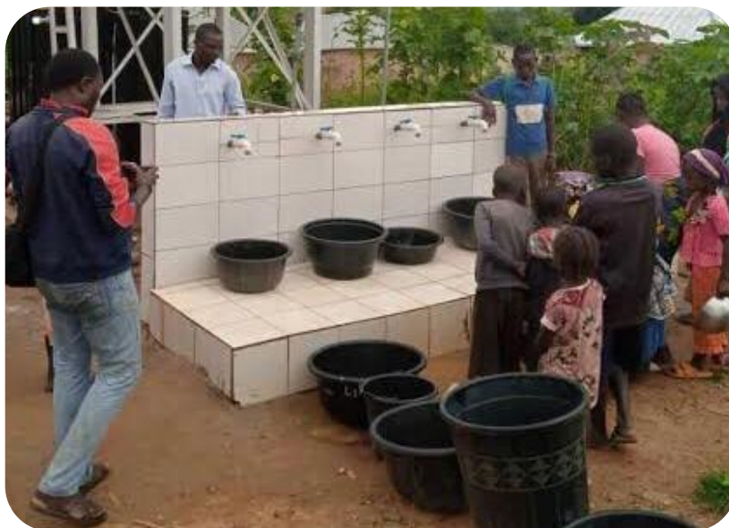
Beispiel eines neuen Brunnens und dessen Wasserversorgung