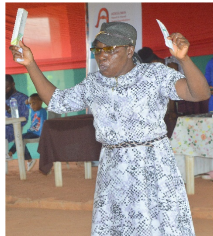
Die Gynäkologin spricht über Familienplanung