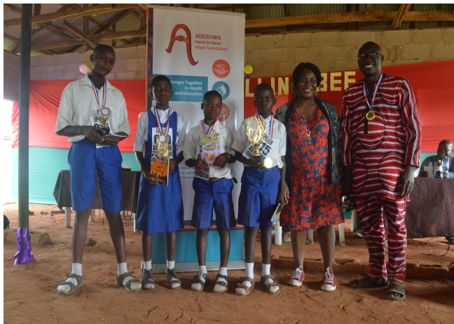
Gewinner des Grundschulwettbewerbs